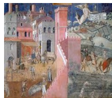
ROTARY: IL BENE COMUNE

Web: www.rotarymiaquileia.it Facebook: https://www.facebook.com/rotaryclubmilanoaquileia