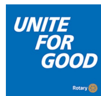
MOTTO DEL PRESIDENTE DEL ROTARY INTERNATIONAL