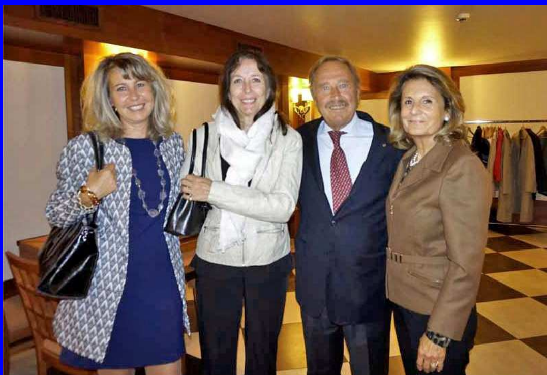
Testo di Flavio Conti - Impaginazione e grafica Luisella Rosti